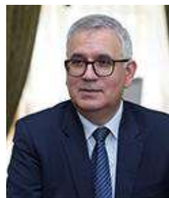
В.Н. Княгинин Вице-губернатор Санкт-Петербурга согласовывается