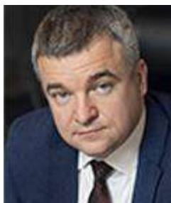
В.В. Шпак Заместитель Министра промышленности и торговли Российской Федерации согласовывается