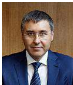
В.Н. Фальков Министр науки и высшего образования Российской Федерации согласовывается